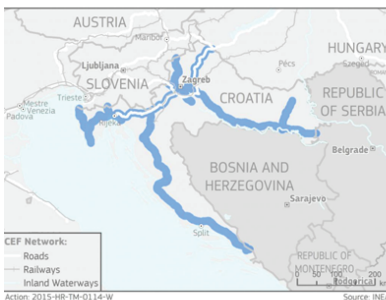
Slika: CROCODILE 2 CROATIA

Projekt CROCODILE 2 CROATIA uključuje upravitelje državnih cesta i autocesta kako bi se osiguralo koordinirano upravljanje i kontrola prometa što će rezultirati visokom kvalitetom usluga informiranja korisnika na jednom od najvažnijih cestovnih koridora u proširenoj Europi.